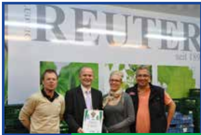
Übergabe der Urkunden an die Teilnehmer