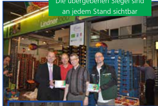
Die übergebenen Siegel sind an jedem Stand sichtbar